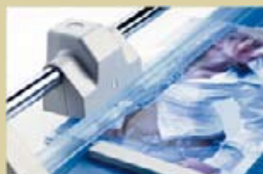
Automatische Pressung an der Schnittstelle