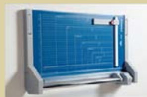
Schneidemaschine montiert an der Wand