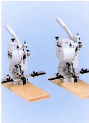
Abb. 101-00 / 101-04