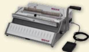
SRW 360 comfort / eco 360 comfort

In nur 3 Minuten vom manuellen zum elektrischen Stanz- und Handbindegerät umgebaut.